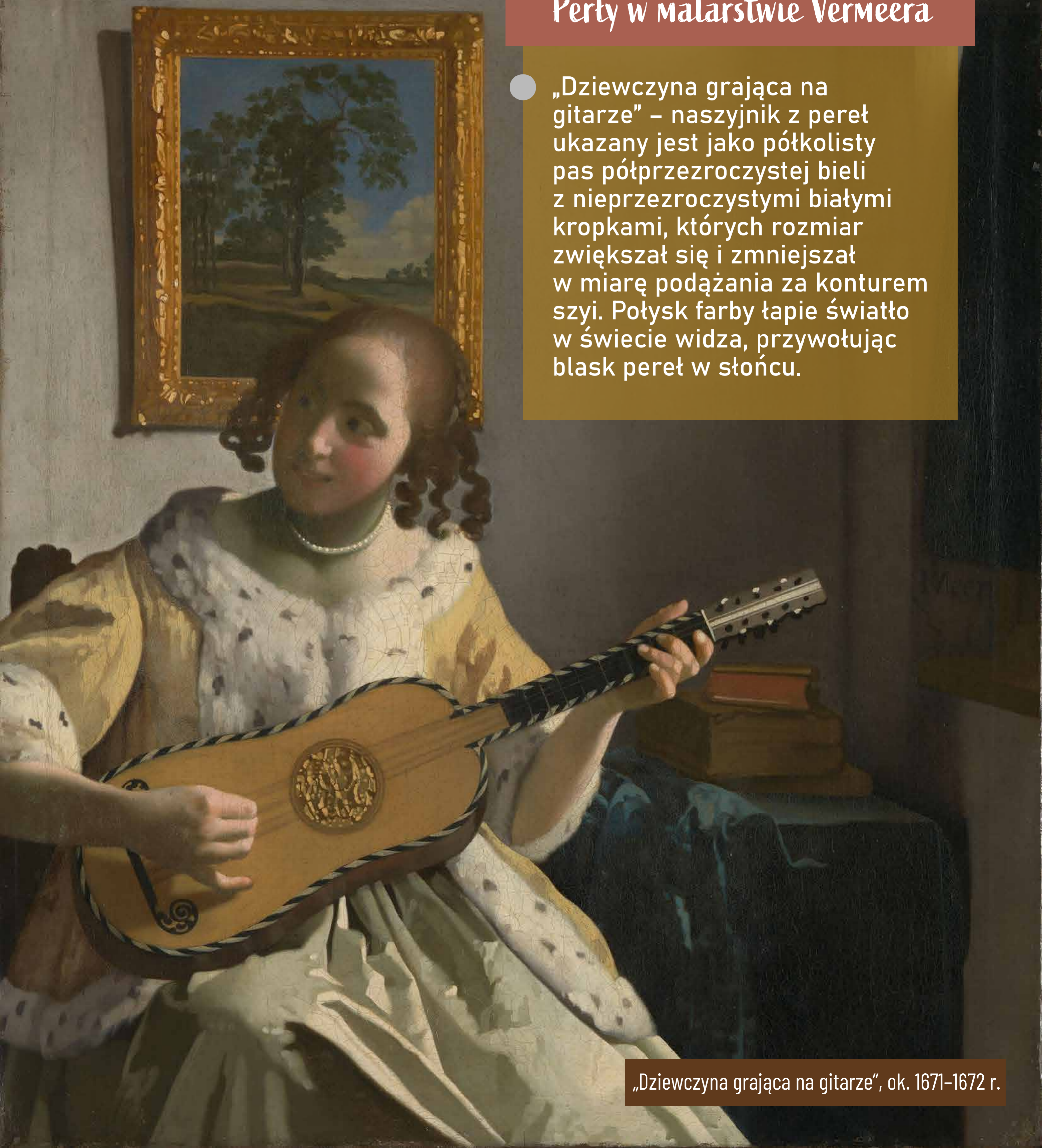
„Dziewczyna grająca na gitarze”, ok. 1671–1672 r.

● „Dziewczyna grająca na gitarze” – naszyjnik z peret ukazany jest jako półkolisty pas półprzezroczystej bieli z nieprzezroczystymi białymi kropkami, których rozmiar zwiększał się i zmniejszał w miarę podążania za konturem szyi. Połysk farby łąpie światło w świetle widza, przywołując blask peret w słońcu.