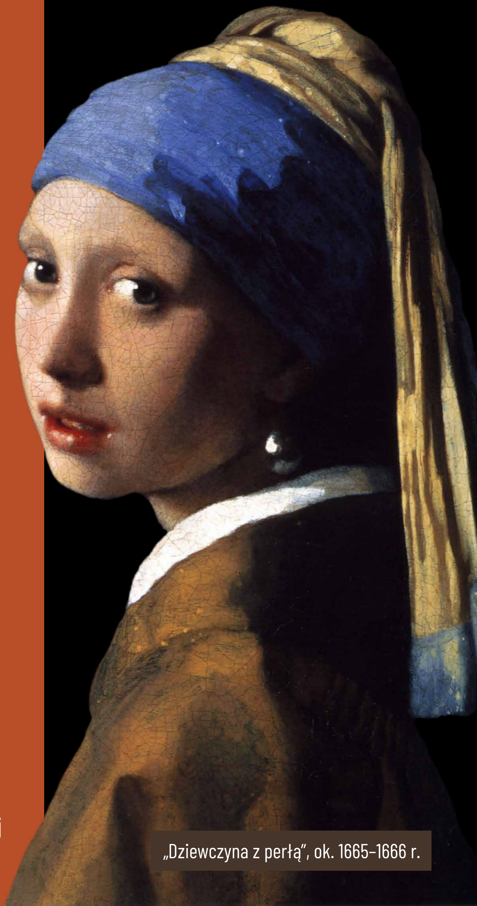
„Dziewczyna z perłą”, ok. 1665–1666 r.