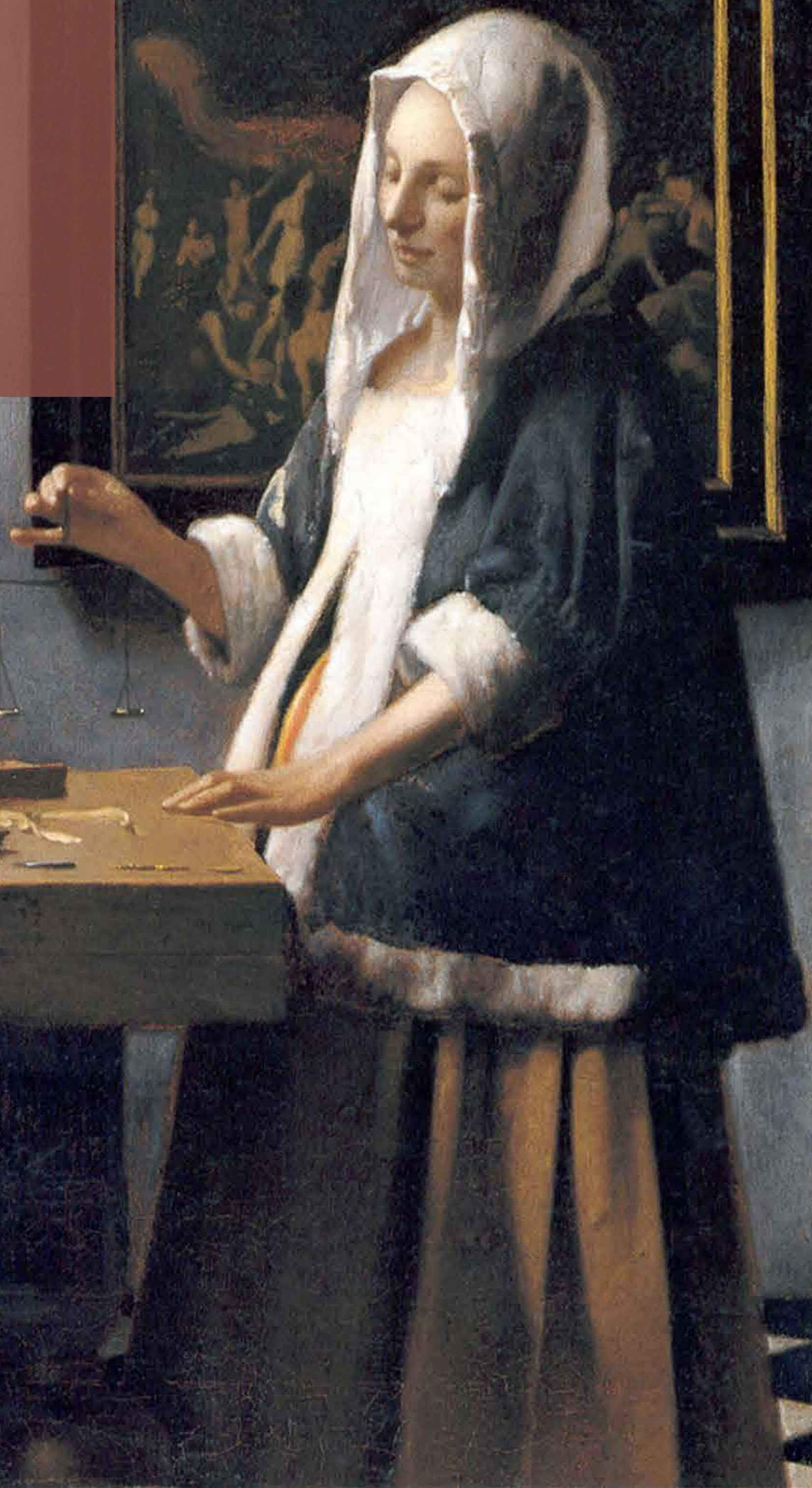
„Ważąca perły”, ok. 1662–1665 r.