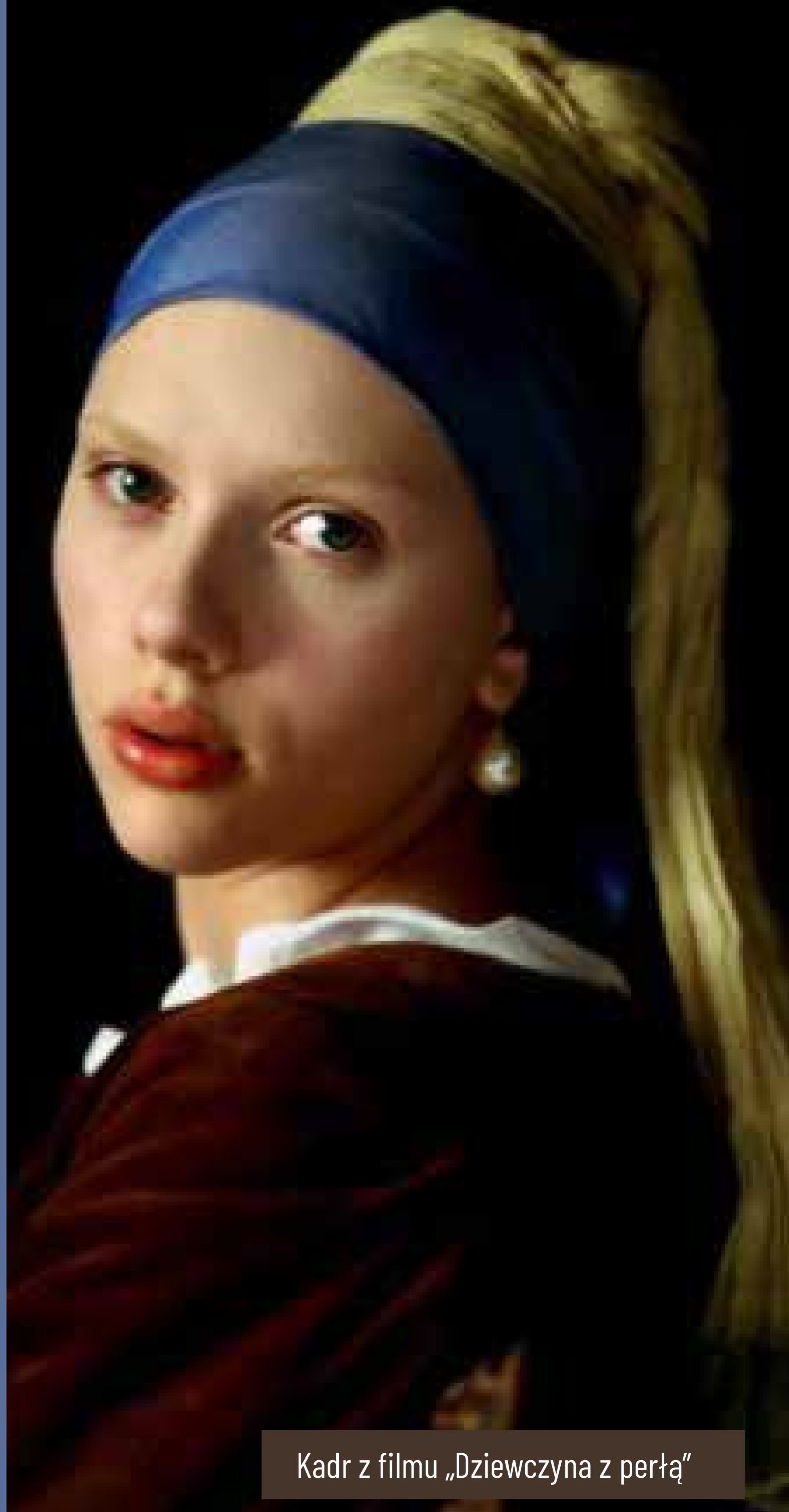
Kadr z filmu „Dziewczyna z perłą”