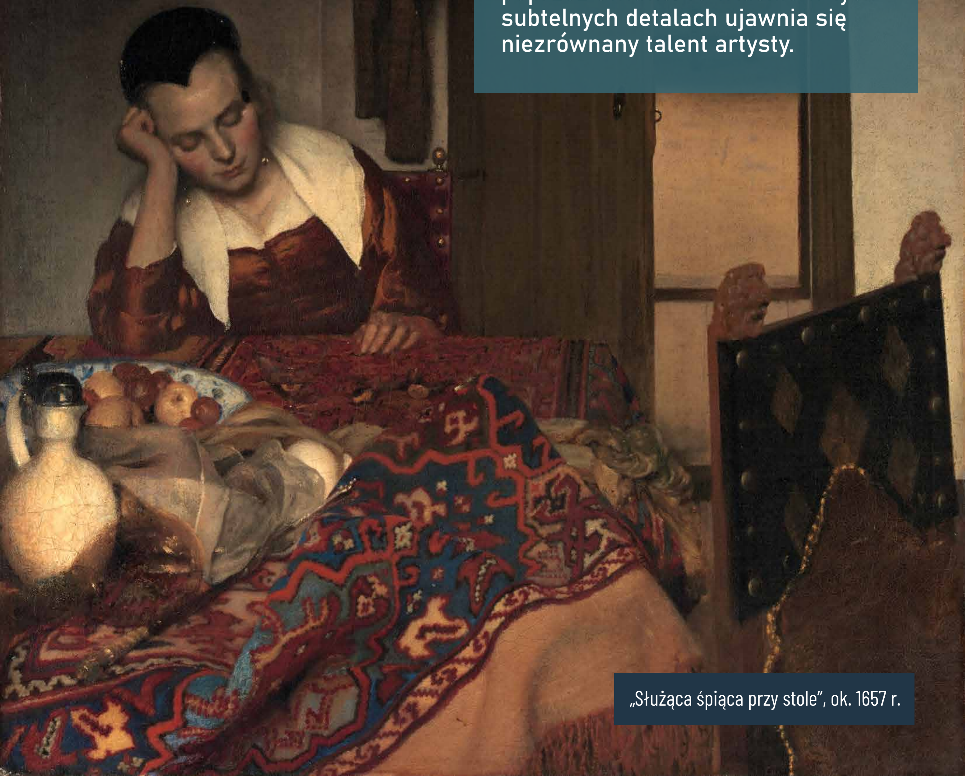
„Służąca śpiąca przy stole”, ok. 1657 r.