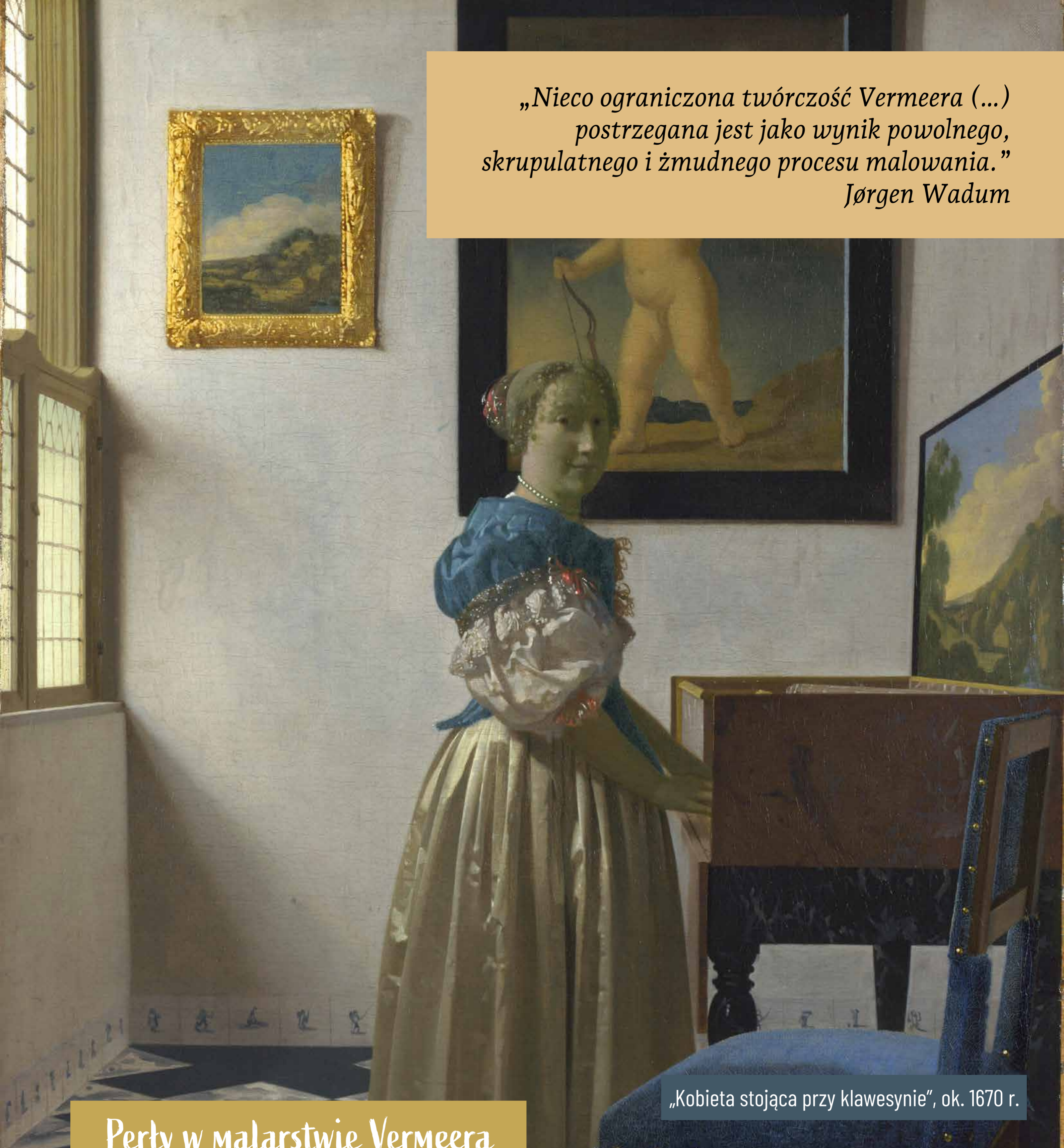
„Kobieta stojąca przy klawesynie”, ok. 1670 r.