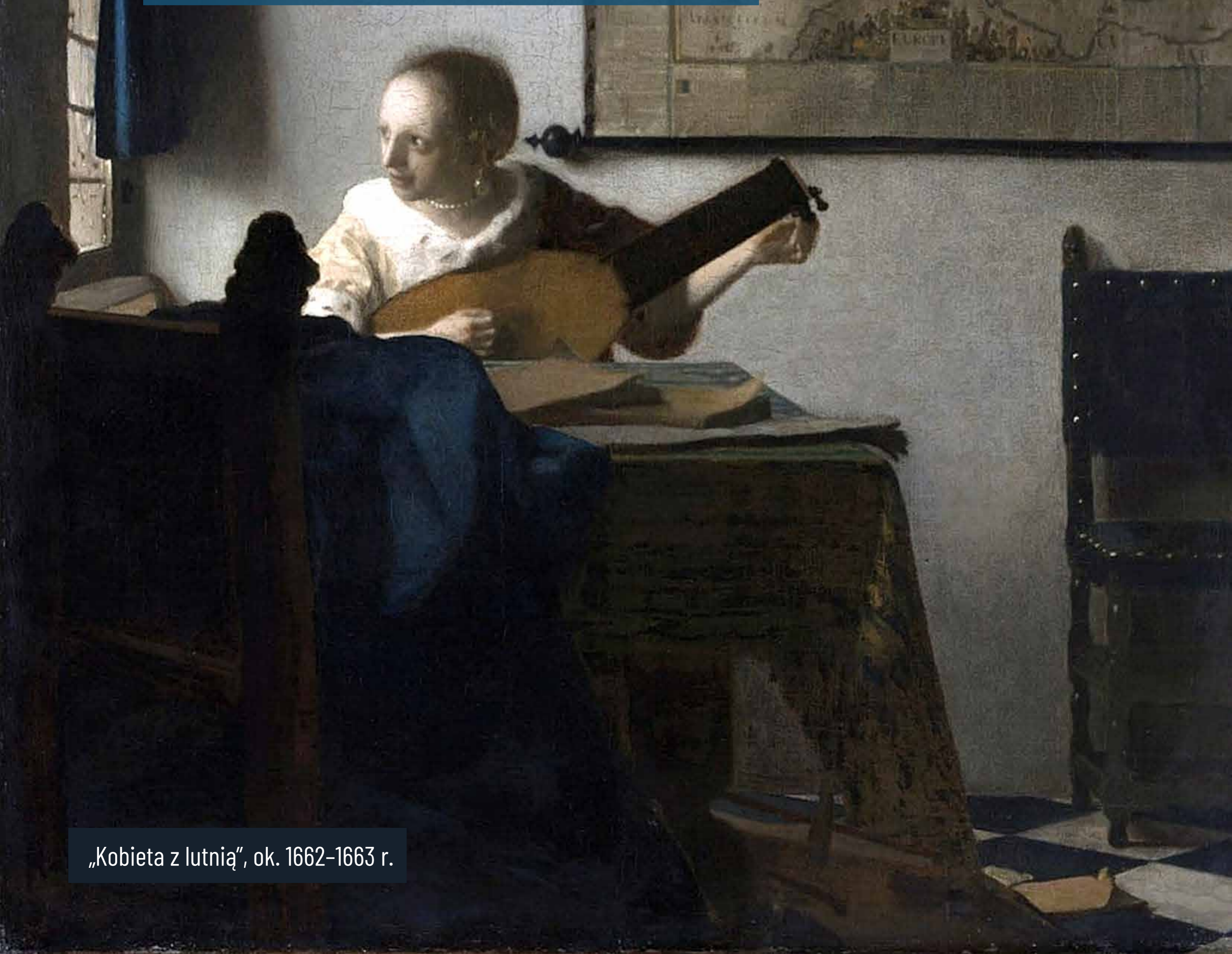
„Kobieta z lutnią”, ok. 1662–1663 r.