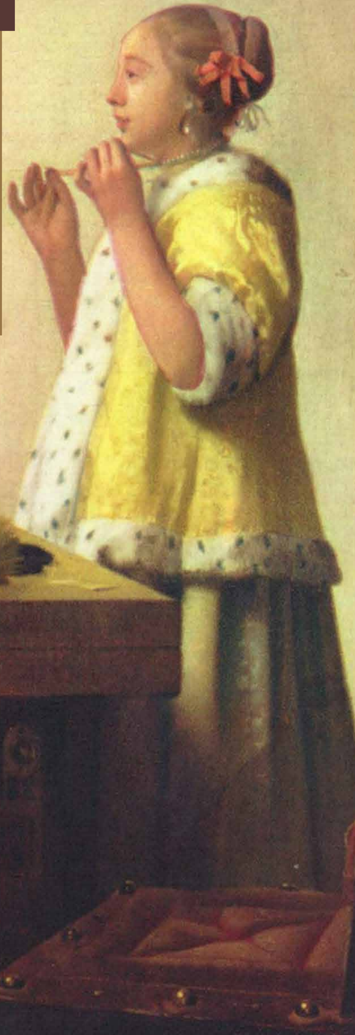
„Sznur pereł”, ok. 1662–1665 r.