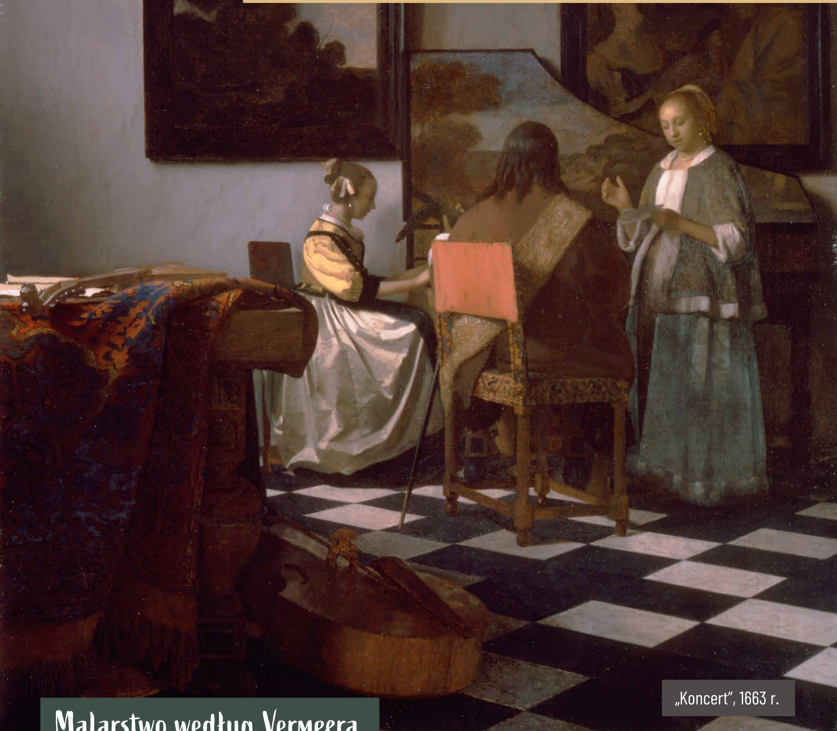
„Koncert”, 1663 r.