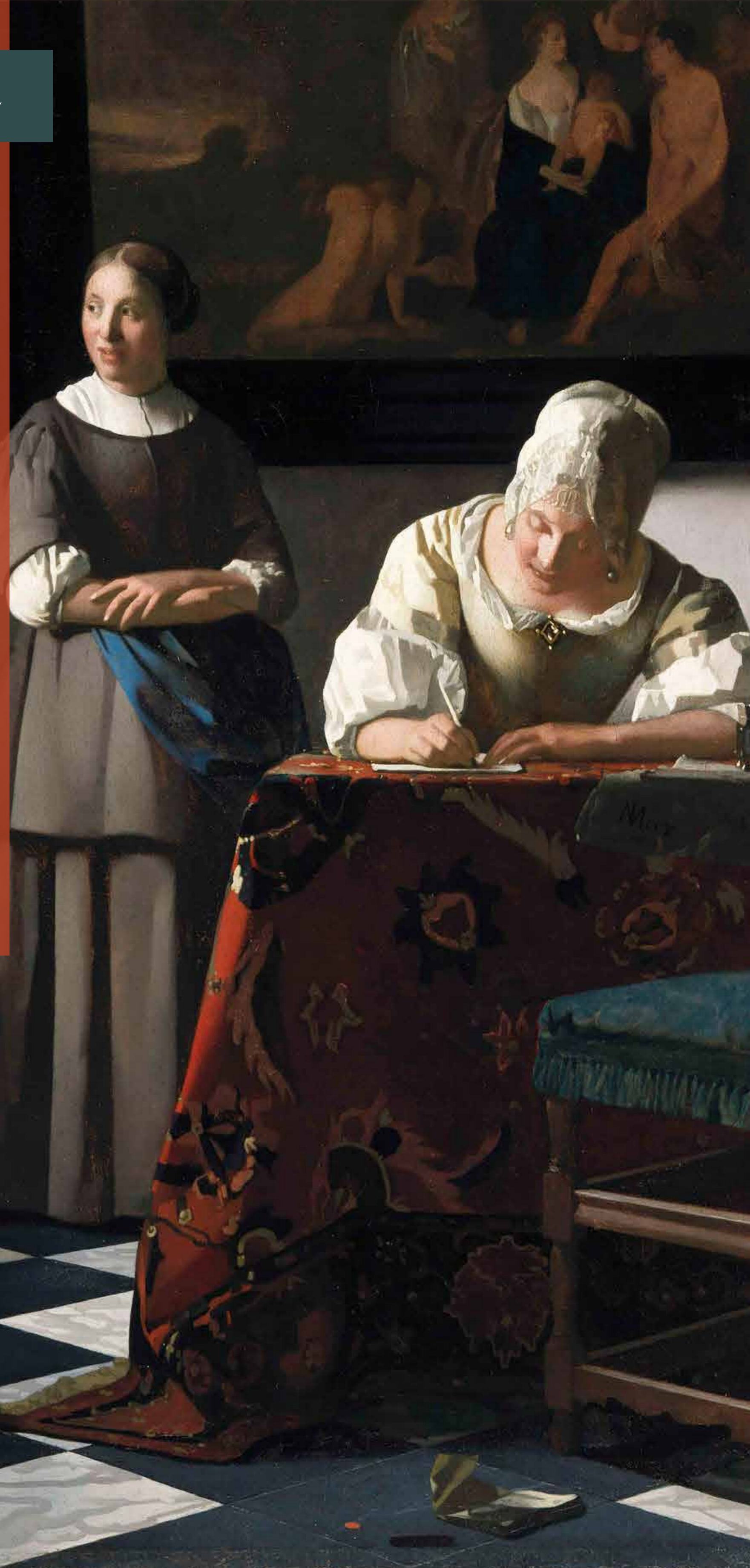
„Pisząca list”, ok. 1671 r.