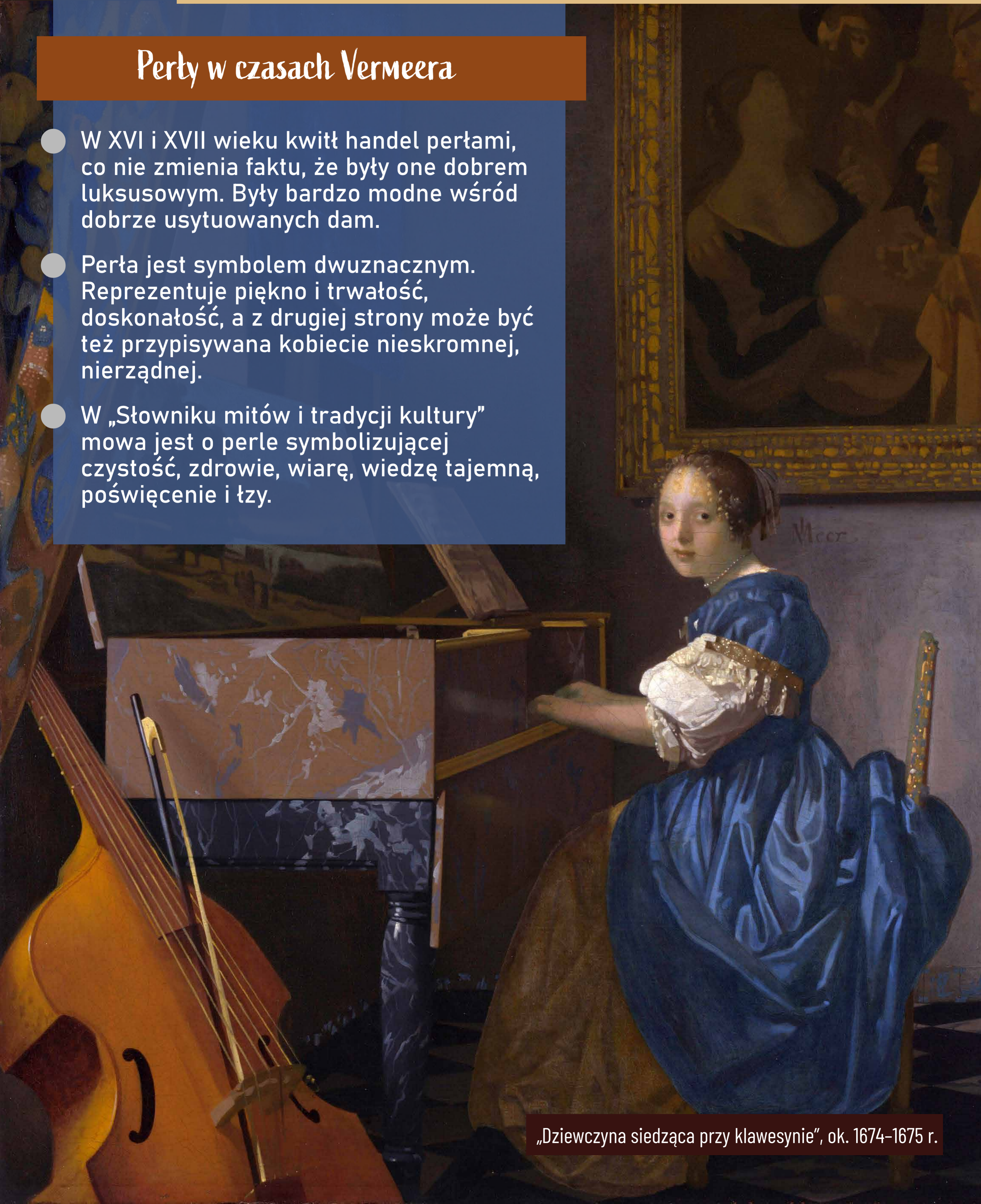
„Dziewczyna siedząca przy klawesynie”, ok. 1674–1675 r.