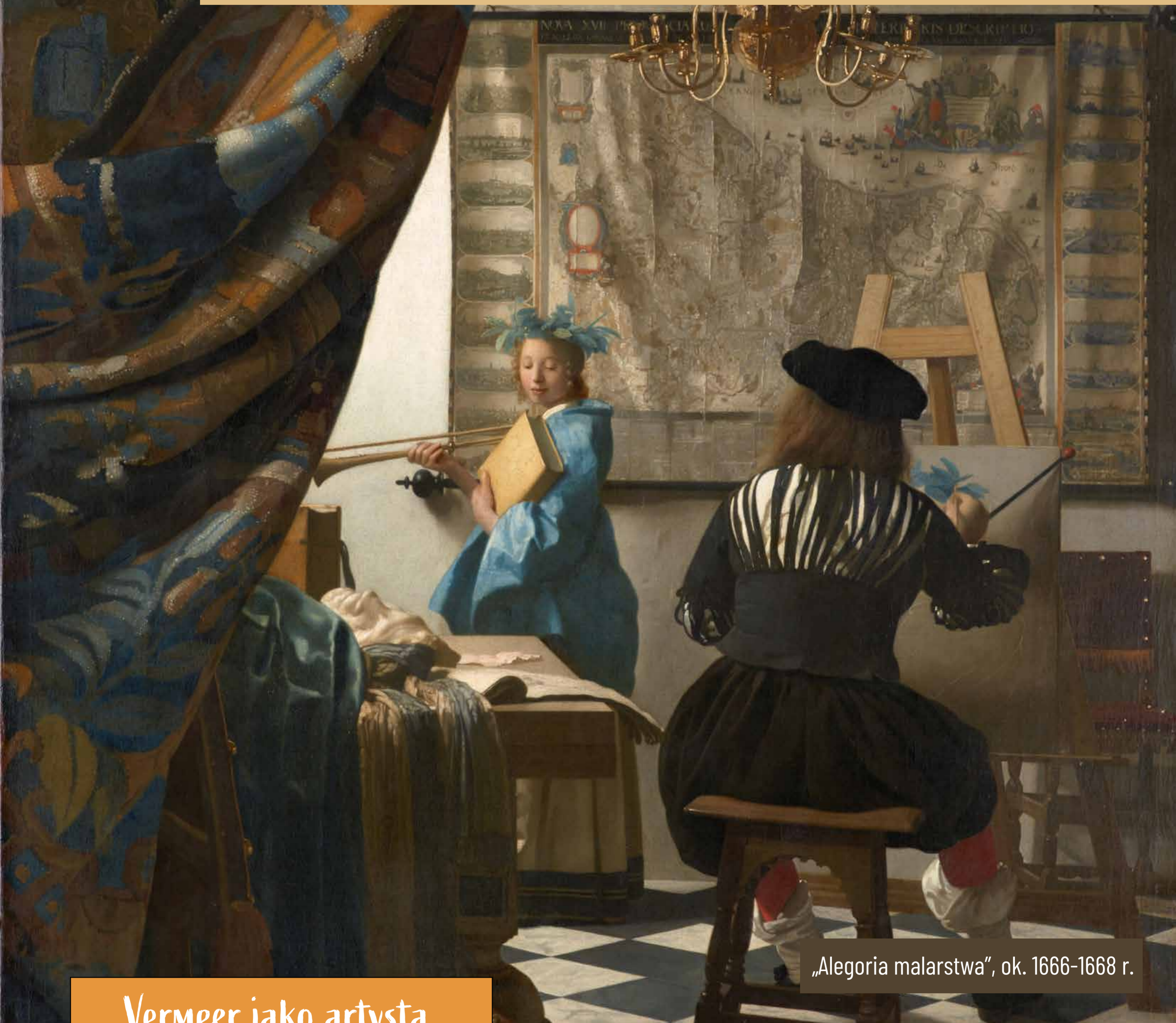
„Alegoria malarstwa”, ok. 1666-1668 r.

„Kiedy człowiek zakosztuje piękna artystycznego, jego życie się zmienia. Zmieniasz się, (...), kiedy zobaczysz Vermeera z bliska; (...) i nie jesteś tym samym człowiekiem.” Jaume Cabré, „Wyznaję”